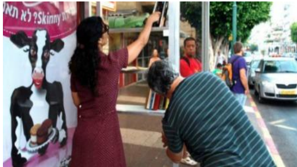
Proyecto: Bibliotecas públicas libres en paraderos en Israel:

“Su lema: Usted puede tomar, usted puede devolver, usted puede agregar”.